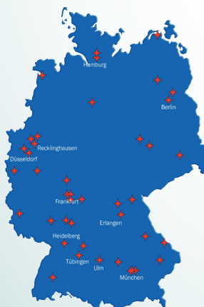
Abb. 1: Bundesweite Verteilung der initiierten Studienzentren

49 Zentren wurden bislang für die Studie initiiert.