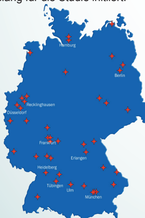
Abb. 1: Bundesweite Verteilung der initiierten Studienzentren

46 Zentren wurden bislang für die Studie initiiert.